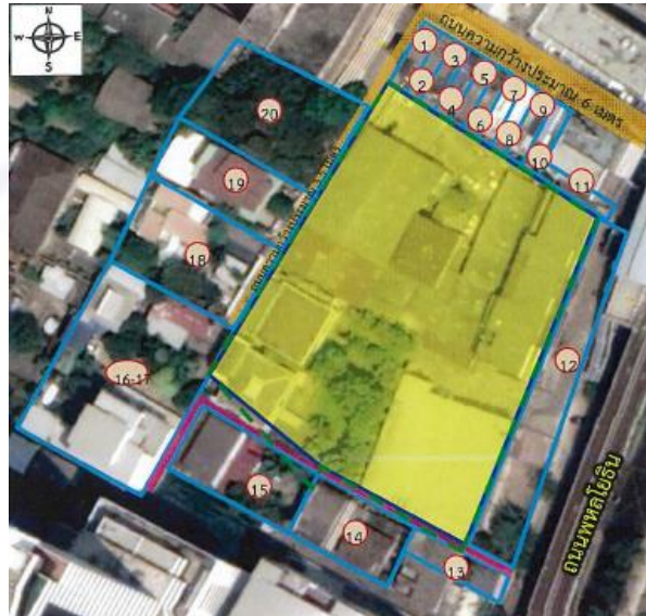
รูปที่ 2 แสดงพื้นที่ติดโครงการ

ดำเนินการสำรวจสภาพเศรษฐกิจและสังคม บริเวณพื้นที่ติดโครงการ วัน สนามเป้า จำนวน 20 ตัวอย่าง (รูปที่ 2)