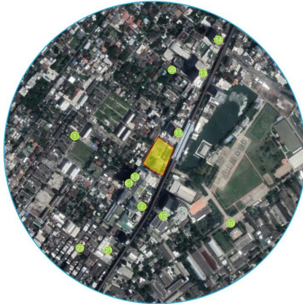
รูปที่ 4 ผังแสดงพื้นที่อ่อนไหวและหน่วยงานราชการ ในระยะ 1,000 เมตร จากขอบเขตพื้นที่โครงการ

ดำเนินการสำรวจสภาพเศรษฐกิจและสังคม พื้นที่อ่อนไหวและหน่วยงานราชการ ในระยะ 1,000 เมตร จากขอบเขตพื้นที่โครงการ วัน สนามเป้า จำนวน 22 ตัวอย่าง (รูปที่ 4)