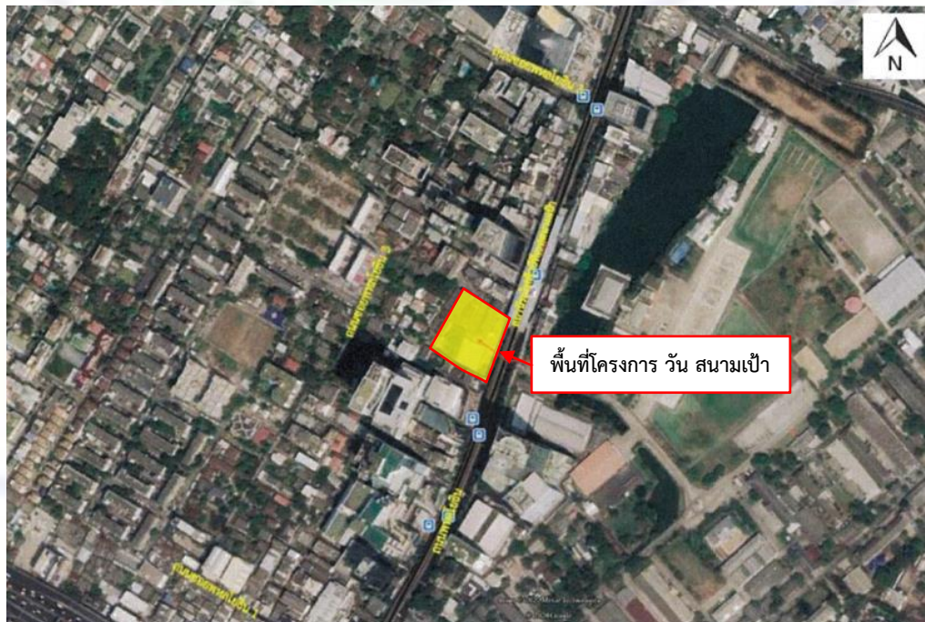
รูปที่ 1 แสดงตำแหน่งพื้นที่ตั้ง โครงการ วัน สนามเป้า

ดำเนินการสำรวจสภาพเศรษฐกิจและสังคม โครงการ วัน สนามเป้า พื้นที่โครงการ ตั้งอยู่ที่ ถนนพหลโยธิน แขวงสามเสนใน เขตพญาไท กรุงเทพมหานคร (รูปที่ 1) โดยมีรายละเอียดการสำรวจ ดังนี้