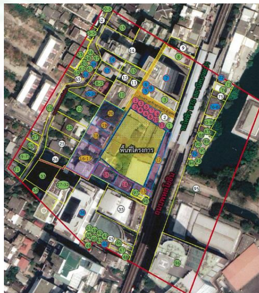
รูปที่ 3 แสดงอาคาร/บ้านที่อยู่ถัดจากพื้นที่โครงการในระยะ 100 เมตร จากขอบเขตพื้นที่โครงการ

ดำเนินการสำรวจสภาพเศรษฐกิจและสังคม บริเวณอาคาร/บ้านที่อยู่ถัดจากพื้นที่โครงการในระยะ 100 เมตร จากขอบเขตพื้นที่โครงการ วัน สนามเป้า จำนวน 98 ตัวอย่าง (รูปที่ 3)